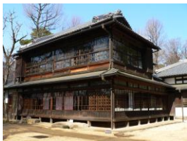
この写真にも著作権があり、無断で利用できない