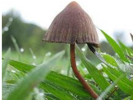
マジックマッシュルーム(シロシベ・メキシカーナ)メキシコ、ハリスコ州 マジックマッシュルーム(Magic mushroom, Psychedelic mushroom,