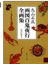
とりやま せきえん

妖怪フィギュア に係る模型原型は、石燕の「画図百鬼夜行」を原画とするものと、そうでないもののいずれにおいても、一定の美的感覚を備えた一般人を基準に、純粋美術と同視し得る程度の美的創作性を具備していると評価されるものと認められるから、 応用美術の著作物に該当する というのが相当である。