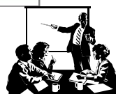
プロジェクトチーム