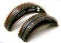
盛り髪用くし コモライフ2個1554円 ダイソー1個105円 550万円 7